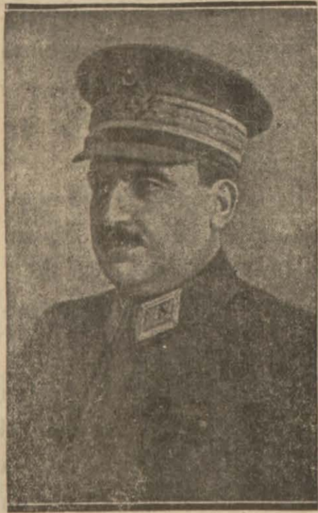
Mareşal Fevzi Çakmak Büyük Erkânîharbiye Başkânı Mareşal Fevzi Çakmak Çocuk Haftası hakkında şu de-

Yurtda Her Şeyin Temeli Ve Her Gücün Kaynağı Türk Çocuğudur